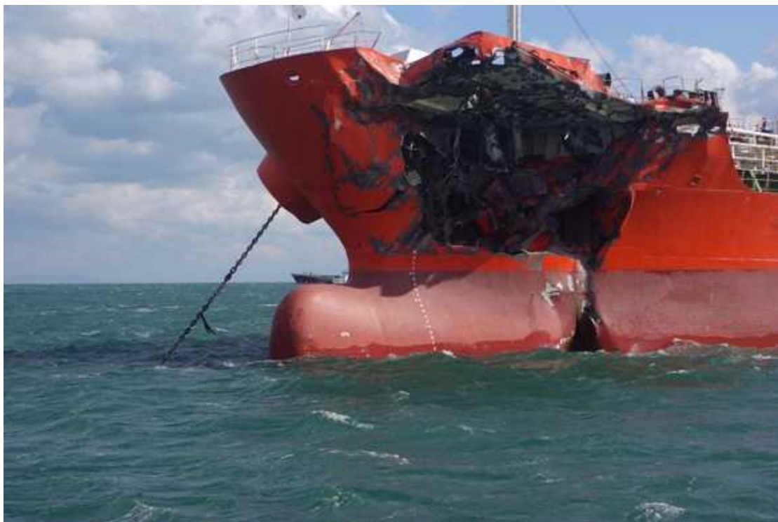
SAMHO HERON(サンホー ヘロン)9149トン