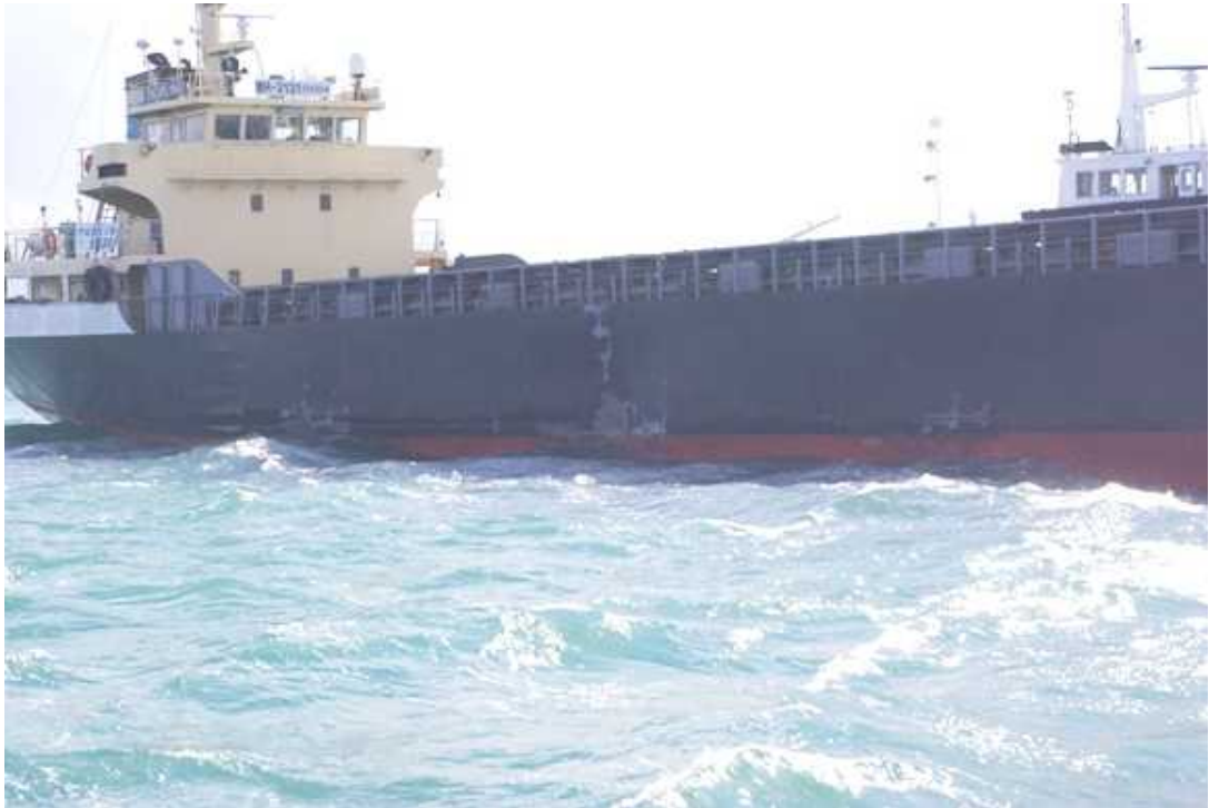
千鶴丸(ちづるまる)499トン