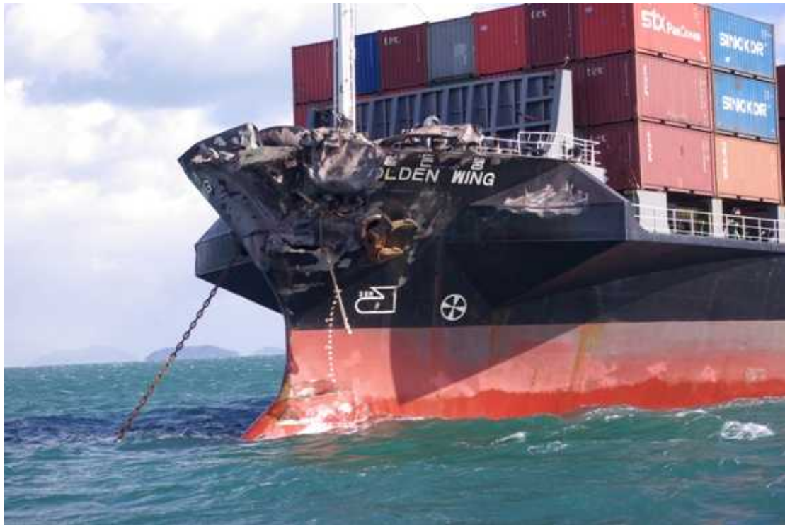
GOLDEN WING(ゴールデン ウイング)8651トン