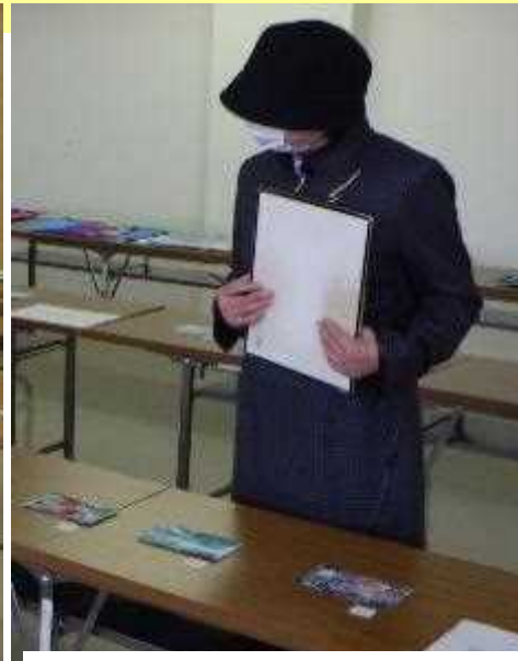
海上保安協力員「水彩画家」