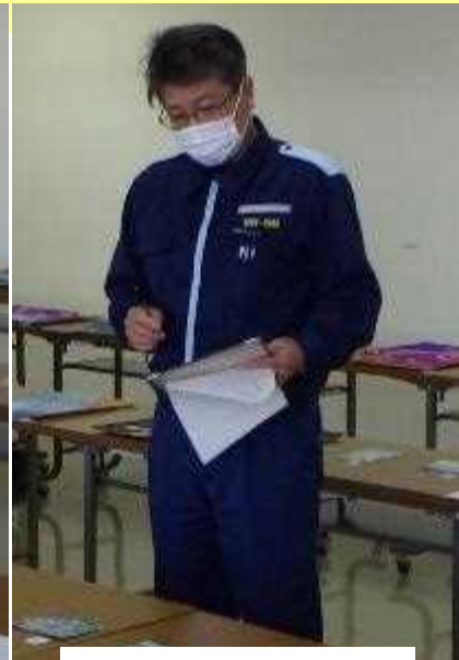
高知海上保安部長

海洋環境保全思想の普及に資することを目的で「未来に残そう青い海」をテーマに毎年実施している図画コンクールは今回で第21回目となりました。部外選考委員を、海上保安協会高知支部長、海上保安協力員「水彩画家」に依頼して、応募作品71作品の中から高知海上保安部長賞、海上保安協会高知支部長賞、佳作を各部門(小学校低学年、高学年、中学生)毎に3作品ずつ、計9作品の選考を行いました。