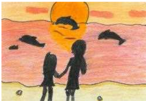
高知海上保安部長賞