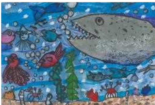
海上保安協会高知支部長賞