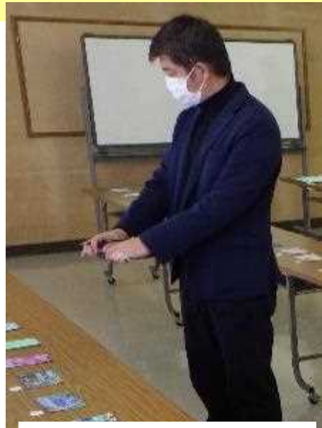
海上保安協会高知支部長