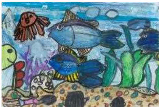
高知海上保安部長賞