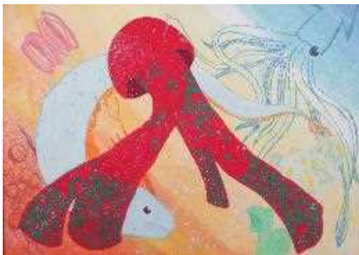
海上保安協会高知支部長賞