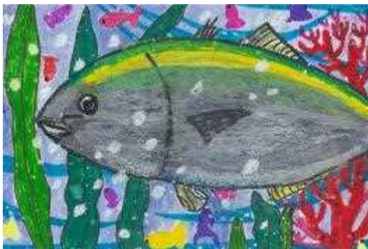
海上保安協会高知支部長賞