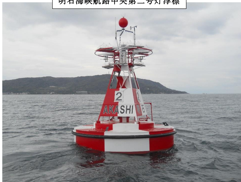
明石海峡航路中央第二号灯浮標