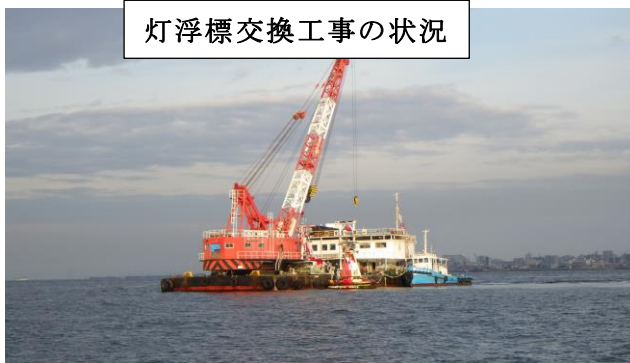
灯浮標交換工事の状況