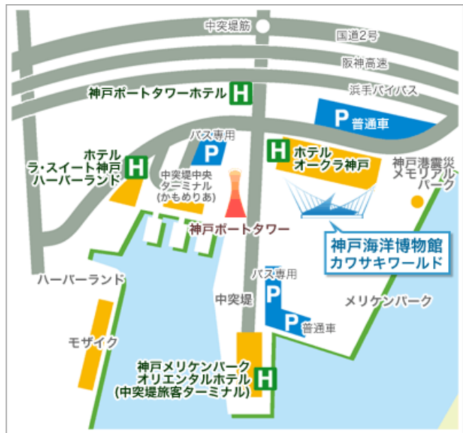
会場案内図