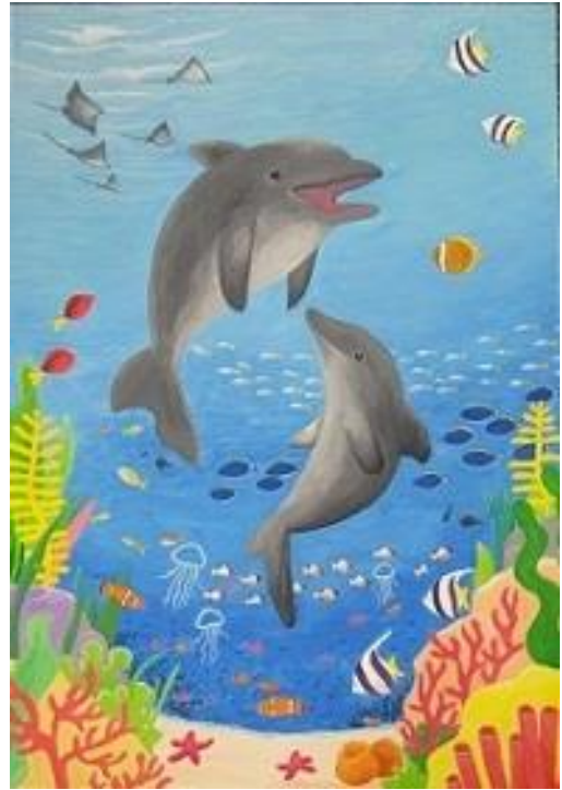
小学生高学年の部