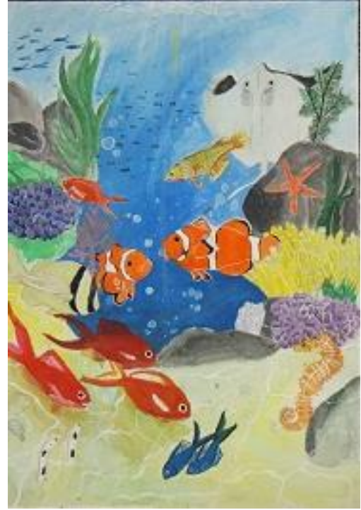
小学生高学年の部