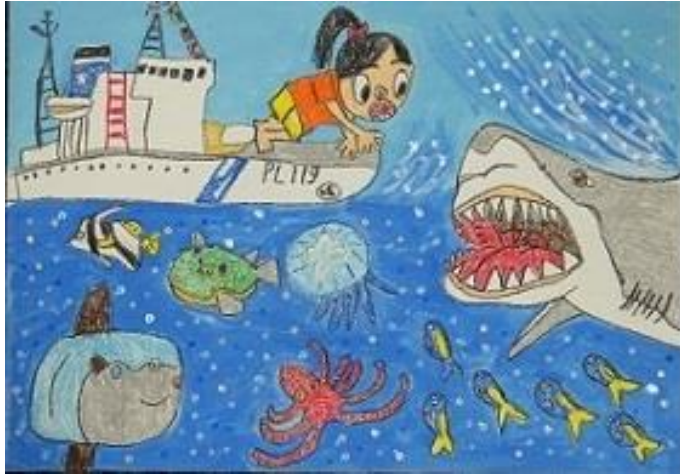
小学生低学年の部