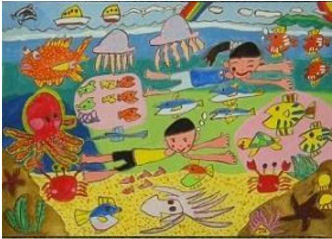
小学生低学年の部