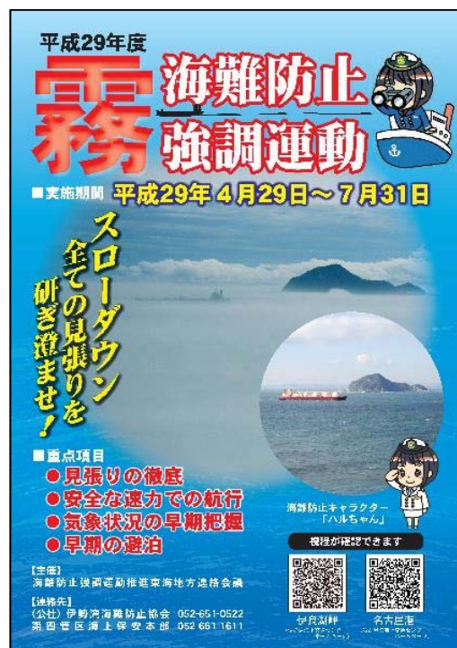
▲霧海難防止強調運動 ポスター

本運動は地域の取組みとして定着してきており、今後も継続して同運動を実施し、視界制限時の事故ゼロ件を目指し取り組んでいきます。