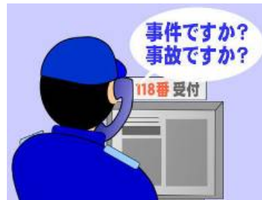
②118番通報を受ける海上保安官