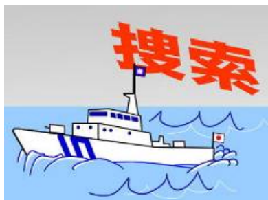
③巡視船艇・航空機による搜索