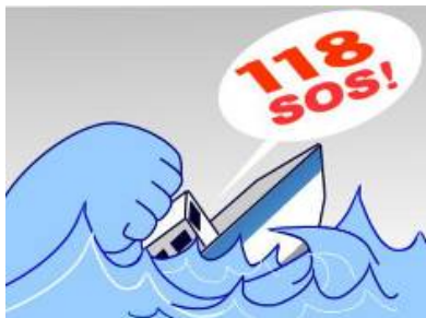
①海難発生救助要請