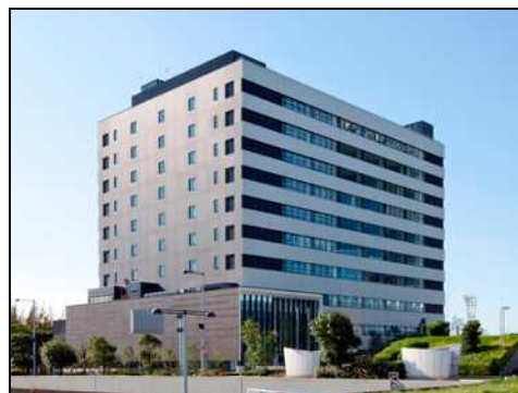
現在の海上保安庁海洋情報部