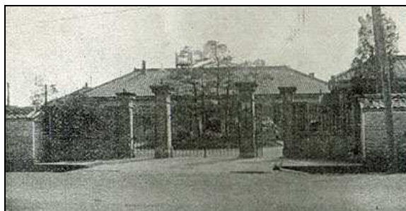
設立当時の水路局

昭和26年(1951年)に海上保安庁が水路局の誕生した7月28日を水路部の創立の日として制定しましたが、昭和46年(1971年)の水路部創立100周年を期して、明治初期に用いられていた太陰暦(旧暦)の7月28日を現在使用されている太陽暦に換算した9月12日を水路部の創立の日として「水路記念日」を制定しました。