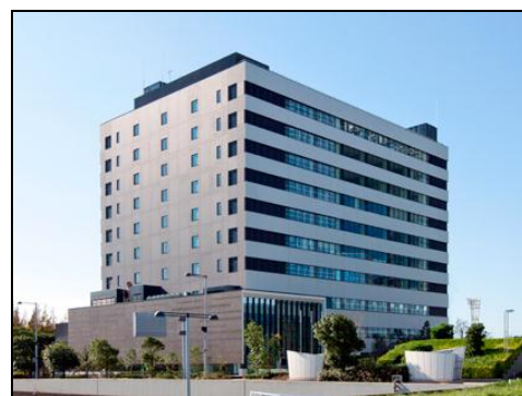
現在の海上保安庁海洋情報部