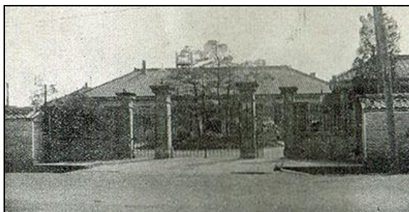
設立当時の水路局

昭和26年(1951年)に海上保安庁が水路局の誕生した7月28日を水路部の創立の日として制定しましたが、昭和46年(1971年)の水路部創立100周年を期して、明治初期に用いられていた太陰暦(旧暦)の7月28日を現在使用されている太陽暦に換算した9月12日を水路部の創立の日として「水路記念日」を制定しました。