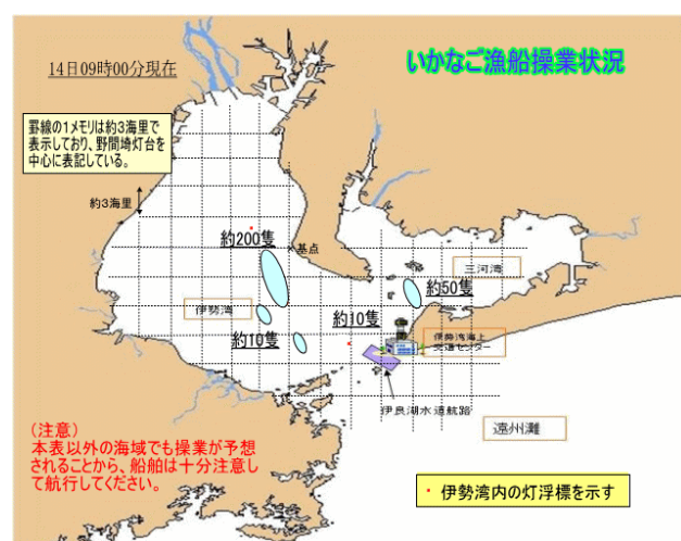
操業漁船操業図 (例)