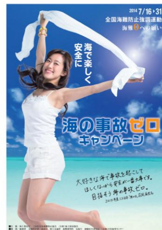
▲キャンペーンポスター

※海難防止強調運動推進東海地方連絡会議 (海事関係者 35 団体、官公庁等 7 機関) 別紙参照