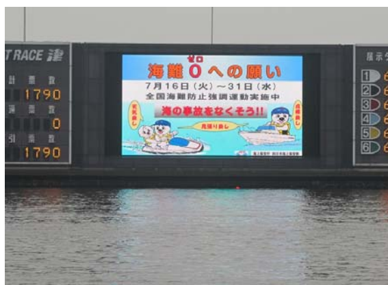
【競艇場オーロラビジョンでの周知映像放送】