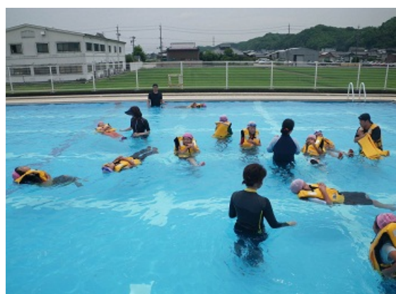
【ライフジャケット着用体験状況】