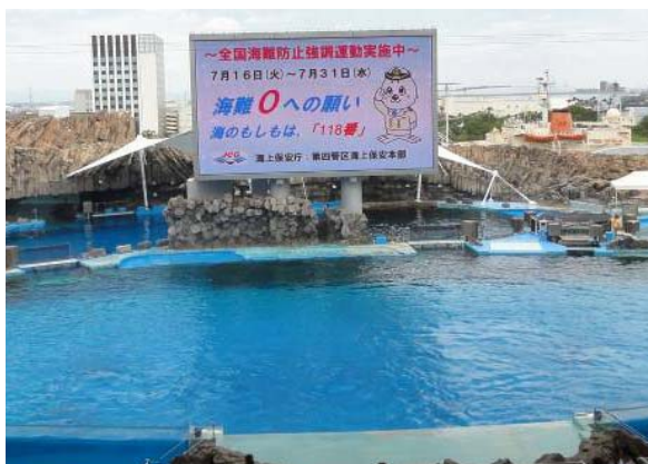
【名古屋港水族館での周知映像放送】