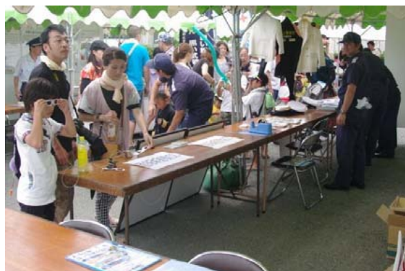
【みなとフェスティバルでの海難防止活動】