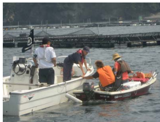
【安全パトロール艇による安全指導】