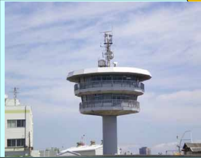
新港信号所(既設航路管制信号施設) 平成 24 年 3 月 13 日 航路管制業務廃止予定