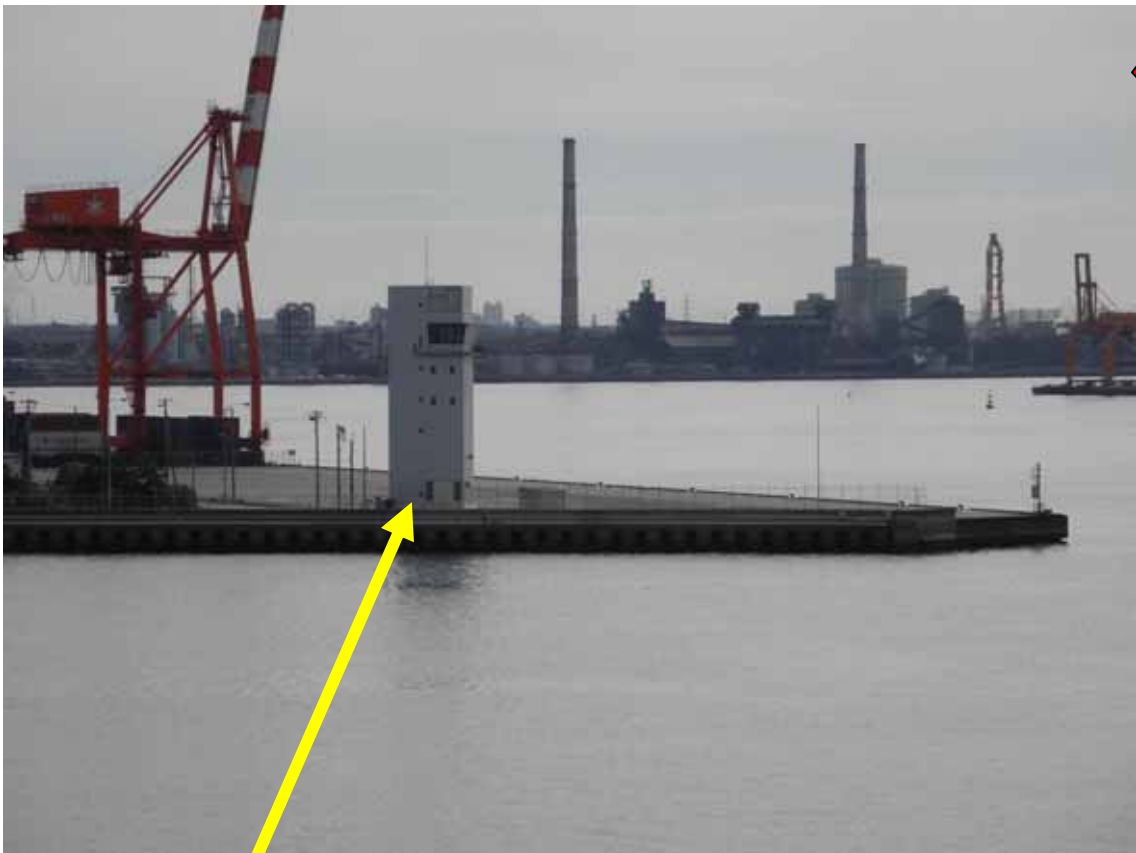
新 信号所 (千葉中央港信号所) 平成 24 年 3 月 13 日 千葉航路管制業務開始