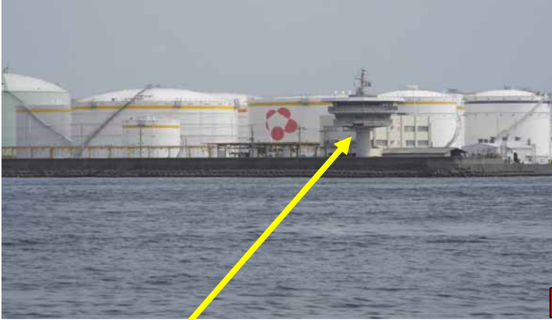
旧 信号所 (千葉新港信号所) 平成 24 年 3 月 13 日 千葉航路管制業務廃止