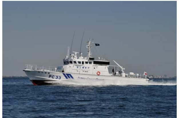
海上試運転中のPC33「うらゆき」