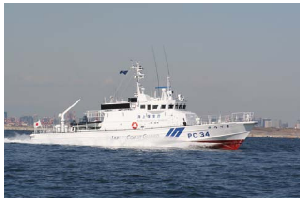
海上試運転中のPC34「ゆうづき」