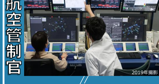
国土交通省 航空管制官