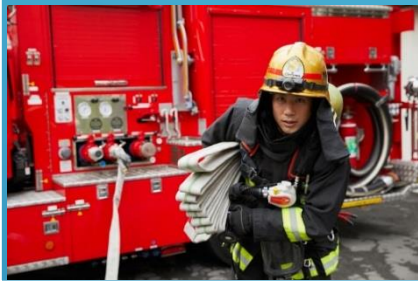
東京消防庁 川崎市消防