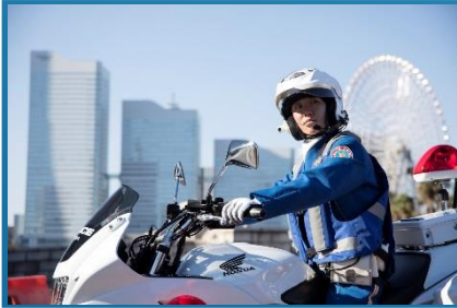
神奈川県警 埼玉県警