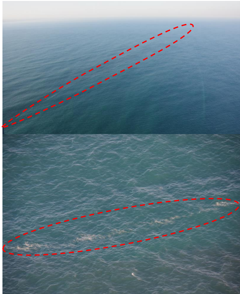
軽石と思われる漂流物の状況写真