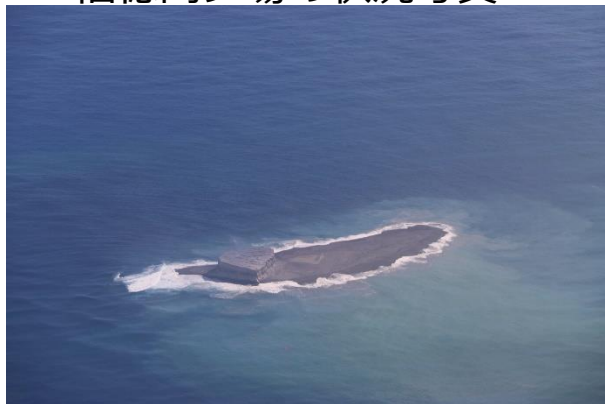
福德岡ノ場の状況写真