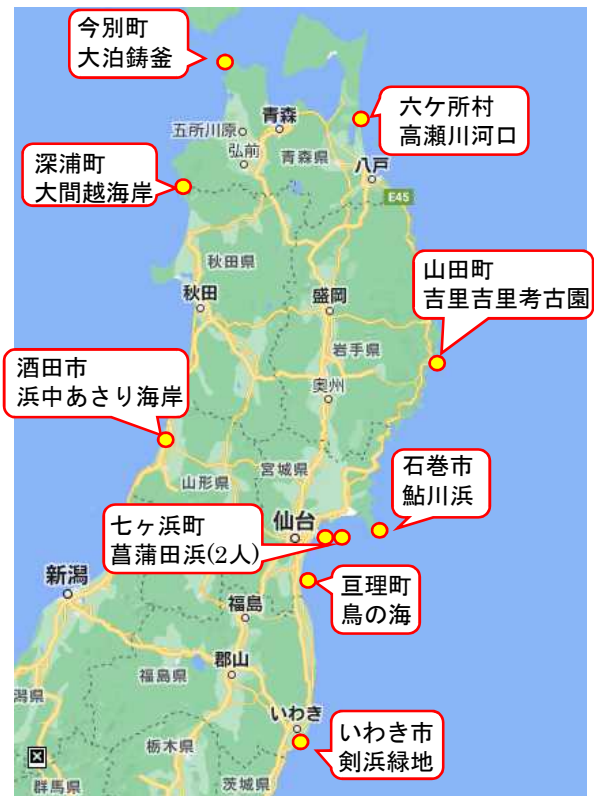
海水浴場以外における遊泳中の死亡事故発生場所(過去5年、東北地方)