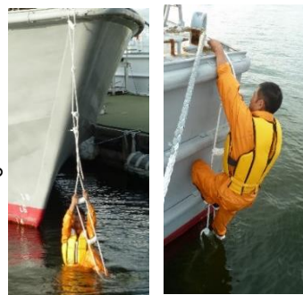
船首取り付け時 船尾取り付け時