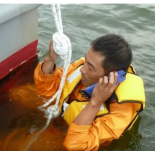
防水パック入り携帯電話