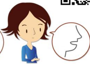
発話に障がいを持つ方