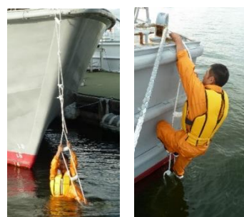
船首取り付け時 船尾取り付け時

船首側に縄梯子を取り付けた場合、外板との間の隙間が大きくなり、縄梯子が触れ回りやすくなり、上るときの姿勢が不安定になるため、船体中央から 船尾側 への取り付けをおすすめします。