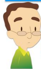
聴覚に障がいを持つ方