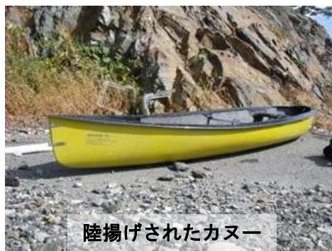
陸揚げされたカヌー

出港前に最新の気象情報をチェックし、カヌーの性能や操船する方の技能に応じて、安全な水域と気象条件の下で遊みましょう。