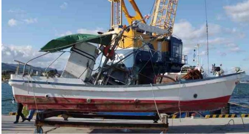
引き揚げられた漁船

昨年11月、防波堤付近に設置しているわかめ養殖施設において小型漁船が操業中、折から発生していた「うねり」が防波堤に打ち寄せたことにより発生した返し波が同船の船尾から船内に打ち込み、機関室が浸水しました。船長はポンプで排水を試みたものの、船尾側からの打ち込んだ波の重みで船尾側が沈下し続け、ついには船首が持ち上げられて船体が海面に垂直となり、船長は海中に投げ