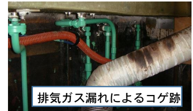
排気ガス漏れによるコゲ跡

高圧管のニップルや排気管のフランジ部のボルト・ナットの緩みの点検、適正なトルクでの締付け、排気管振れ止め対策などを確実に実施しましょう。