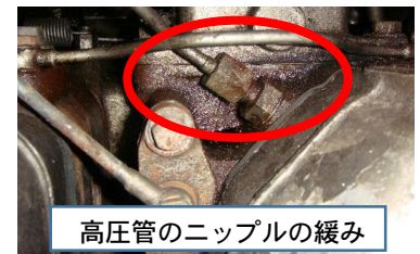
高圧管のニップルの緩み