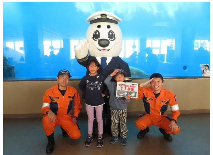
来場者との記念撮影