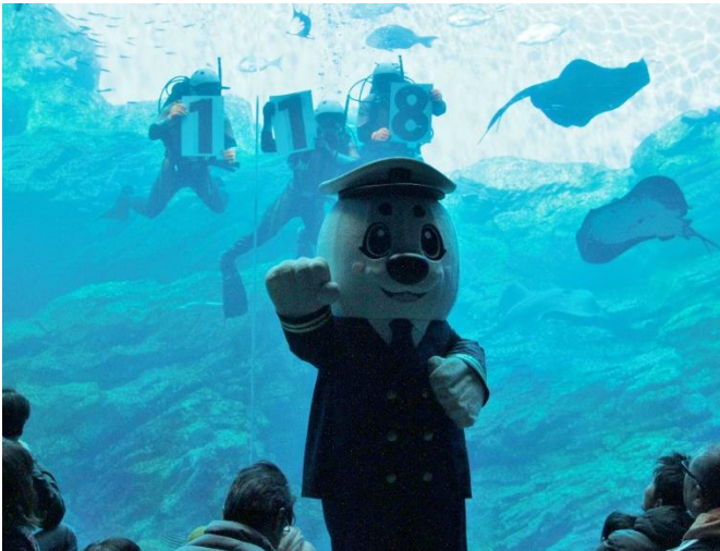
館内における118番周知活動