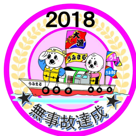
2018年版 達成証(ワッペン)

10月1日から12月31日までの3カ月間における「漁船セーフティラリーみちのく2018」が終了しました！期間中無事故を達成した団体は、参加144団体中 129団体 となり、年間を通して無事故を達成した団体は 113団体 でした！2019年も、仲間同士で声掛けを行い、「 漁船事故ゼロ 」を目指しましょう！