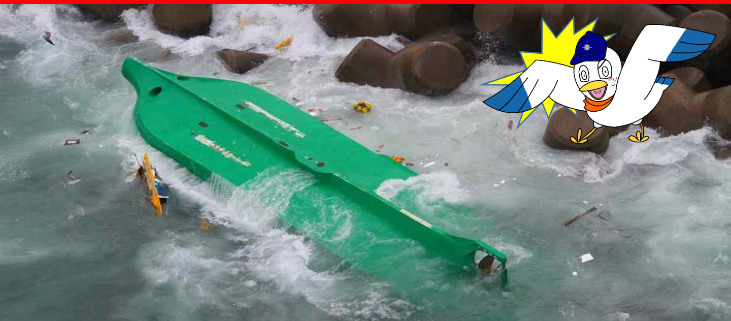
過去5年10月及び11月(漁船海難)