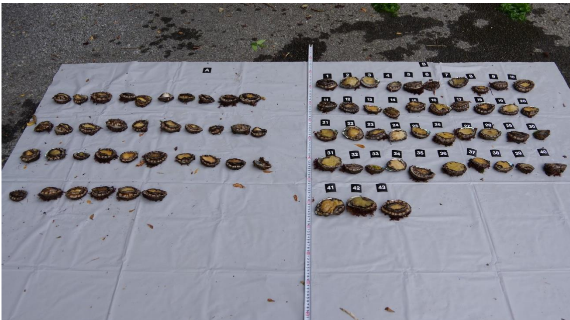
押収した採捕物（あわび）

地元漁業協同組合では「あわび」「なまこ」の種苗を放流した上、「あわび」「なまこ」「うに」漁業の操業日を制限するなど、水産資源の枯渇を防ぐ取り組みを行っています。