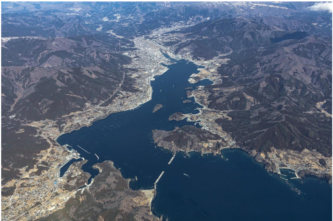
天然の良港 大船渡湾 (重要港湾 大船渡港)

釜石海上保安部は、美しい青い空と海と緑の大地、海洋資源が豊かなこの三陸で地域の皆様に寄り添い、海の安全安心の確保に努めます。