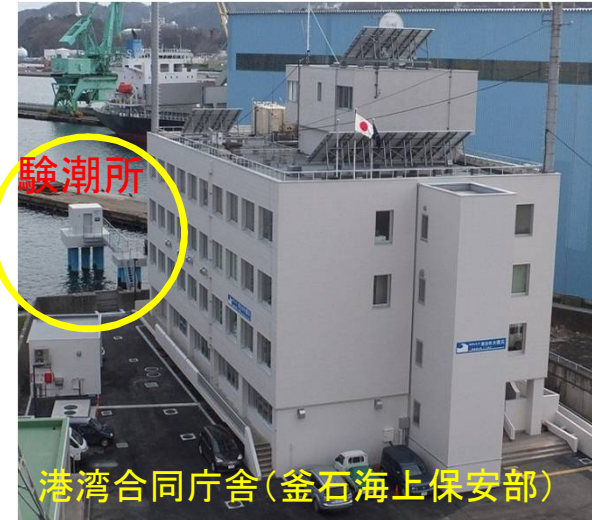
港湾合同庁舎(釜石海上保安部)