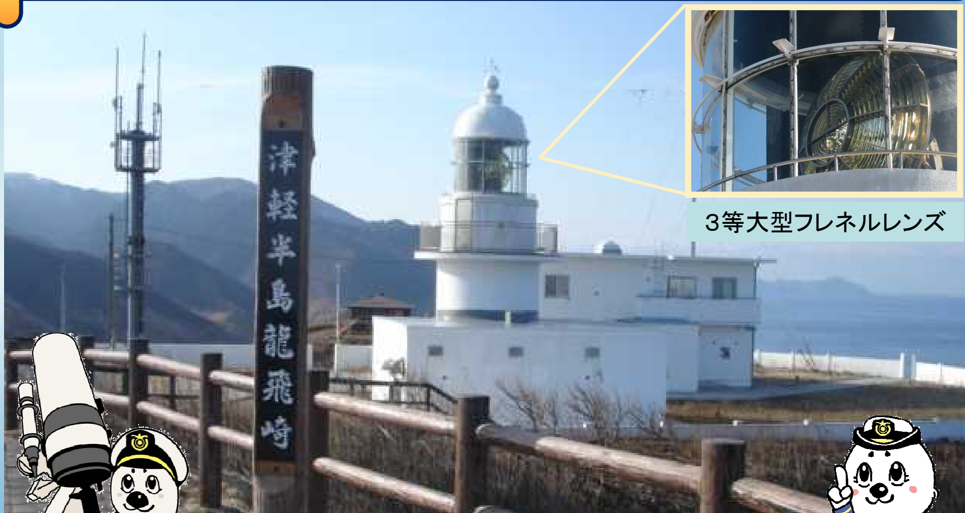
3等大型フレネルレンズ