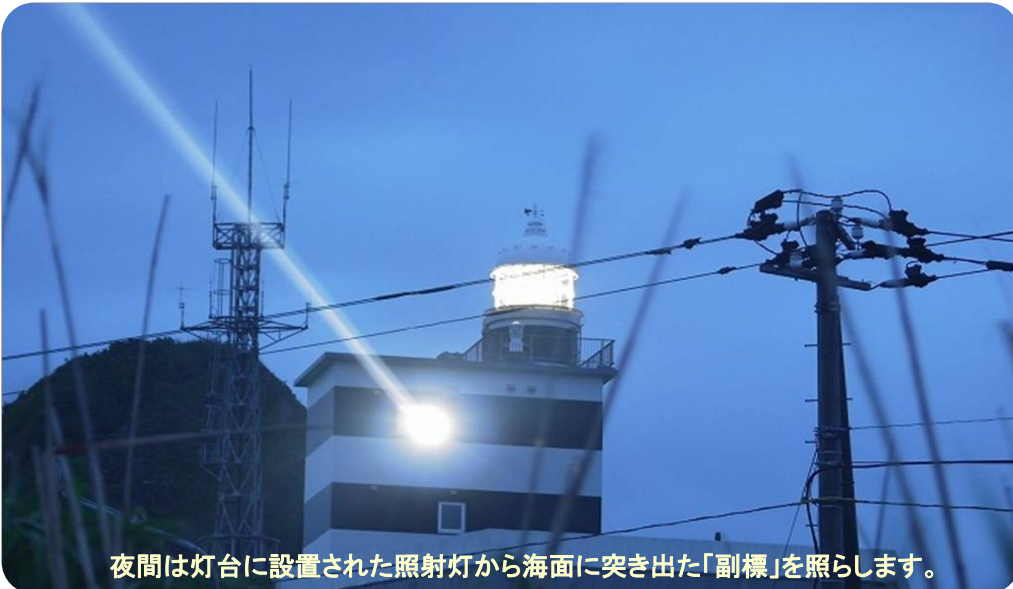
夜間は灯台に設置された照射灯から海面に突き出た「副標」を照らします。

航路標識は、船舶が安全かつ能率的に航行するために設置されている海の「道しるべ」です。それぞれの役割を正しく理解して事故のない安全な航海に努めましょう。航路標識には、浅瀬などの危険な位置をしらせる照射灯があります。