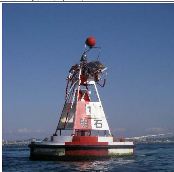
「明石海峡航路中央第一号灯浮標（神戸）」 衝撃で灯浮標と錘をつなぐ鎖が切れ一時漂流