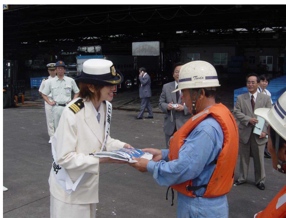
○一日海上保安官による訪問指導