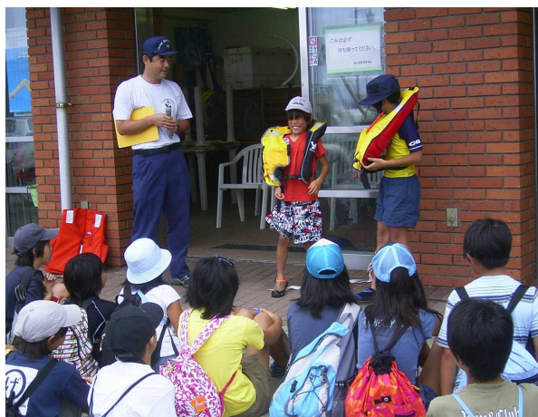
○自己救命策の確保PR