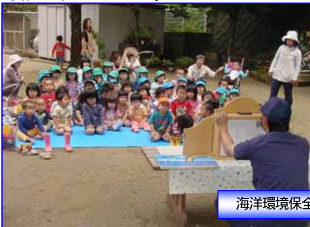
海洋環境保全教室の状況

参加者の方々は普段、遊びや仕事で利用する海の環境保全の重要性を改めて認識するとともに、綺麗な海を将来に残すべく自分が出来ることを再認識する機会となりました。