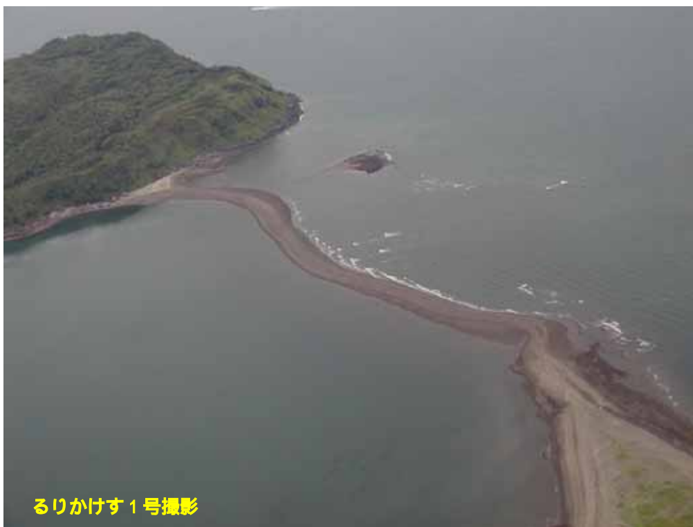
るりかけす 1号撮影

ただし、島に渡れる時間帯は非常に短く昨年も島に取り残された事例があり、また、周辺は砂州が形成されるほどに潮の流れが速いので、決して泳いだり無理して渡ることのないようお願いします。(別添、測量船いそしお観測データ参照)