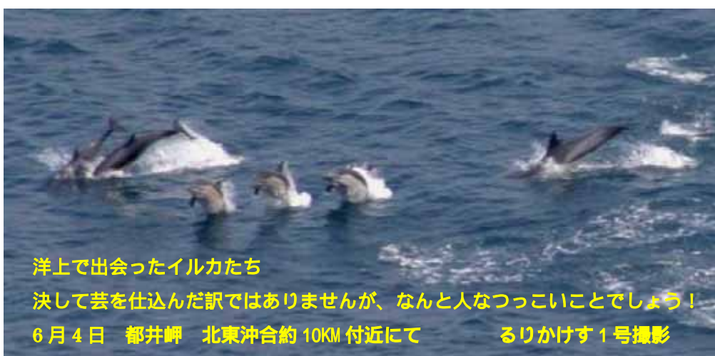
洋上で出会ったイルカたち