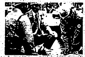
人命救助訓練経費