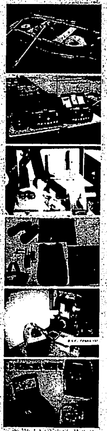
救助用物品及び資機材購入