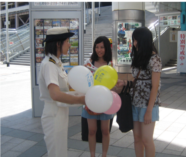
女性海上保安官による呼びかけ

また、『自己救命策3つの基本推進CM』が、大型スクリーン「アミュビジョン」において、7月17日から8月8日の間、1日7回放映されます。