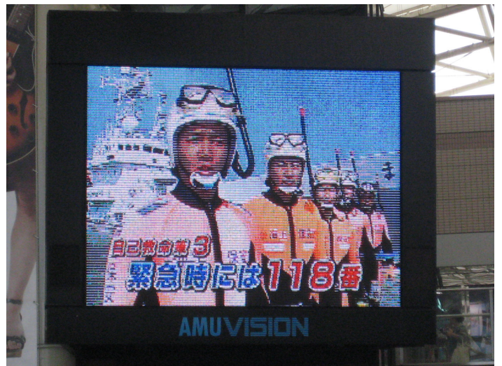
大型スクリーンによる周知