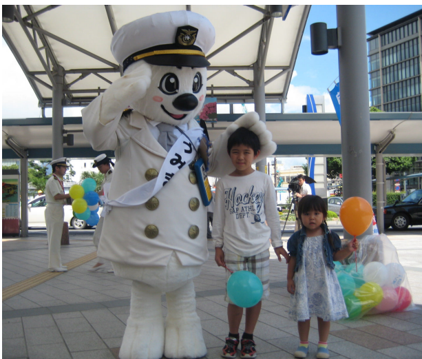
うみまると記念撮影