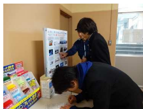
～アンケート実施の様子～

アンケートにご協力いただいた一般の方の中から、抽選で20名様に海上保安庁オリジナルグッズをプレゼントします。