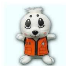
ぬいぐるみキーホルダー (ライフジャケットうみまる)