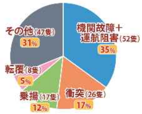
事故種類別発生状況