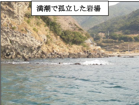
満潮で孤立した岩場

Aさん、Bさん(両名とも29歳男性)は、干潮時に陸岸から離れた岩場に岩を伝って渡り、磯釣りを行っていたところ、満ち潮により、立っていた岩場が水没し始め、渡ってきた岩も水没したため帰ることができなくなり、海上保安部に救助を要請しました。幸い付近を通りかかった地元漁船がこれに気付き、船に乗り移らせて事なきを得ました。なお、AさんとBさんはライフジャケットを着用していませんでした。