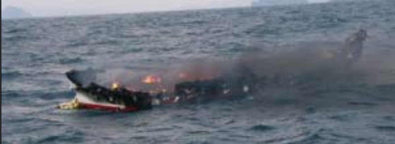
全焼状態の瀬渡しし船F丸

～事故からの教訓～ 無事救助に至ったのは船長がライフジャケットを着用していたのが大きな要因です。海水温度も比較的高かったようですが、災難は時を択びません。突然の事故のためにも乗船中は常時着用が基本です。船長は、携帯電話で助けを求める際、慌てていたため海に落としたそうです。