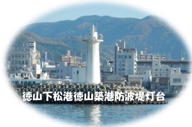
徳山下松港徳山築港防波堤灯台

内容： ・灯台施設一般公開（灯台内部が見学できます。灯台上部から徳山の港の風景がうかがえます！） ・海上保安庁クイズコーナー（クイズ全問正解の方には素敵なプレゼントも！？）