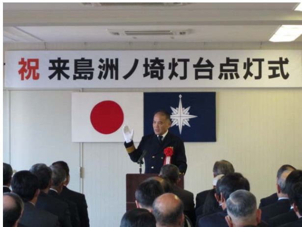
第六管区海上保安本部長挨拶