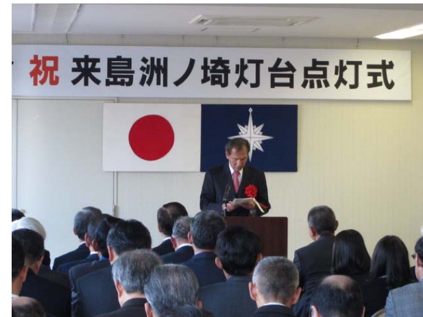
海上保安協会今治支部長祝辞