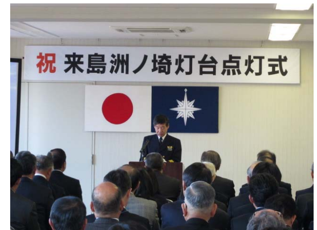
今治海上保安部長式辞