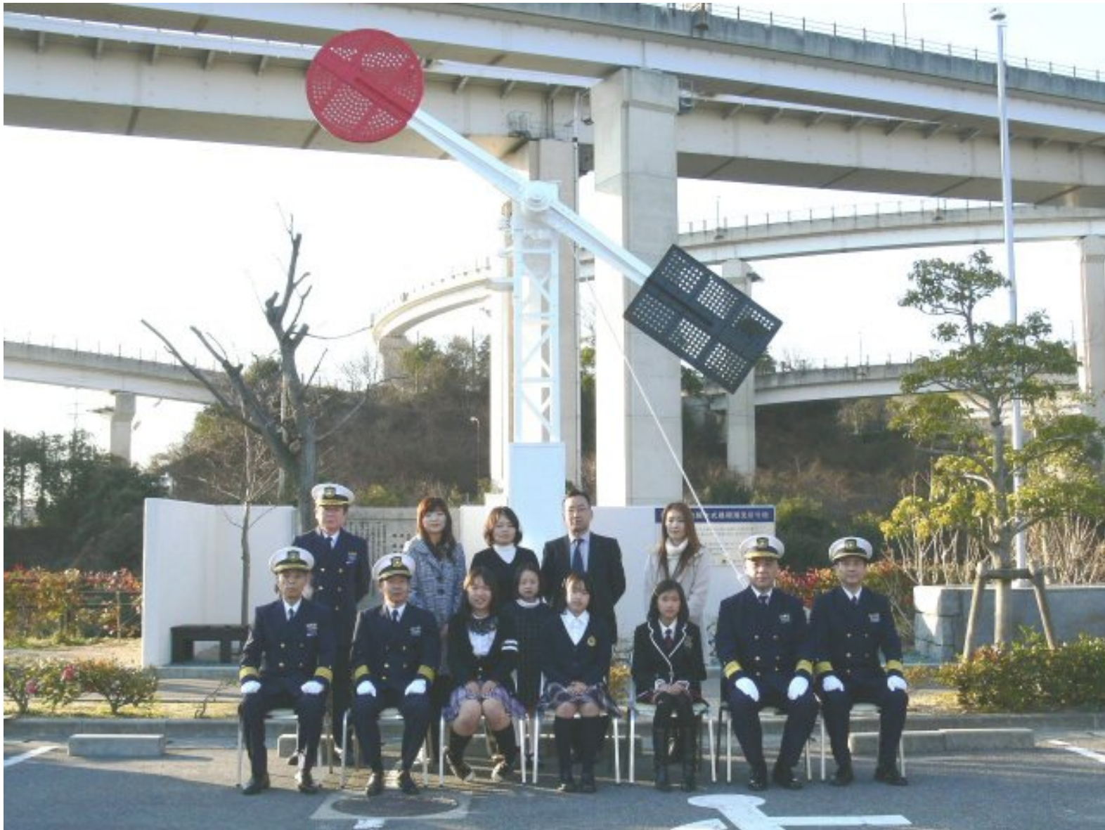
記念撮影（サンライズ糸山 旧中渡島潮流信号所腕木式信号機前）