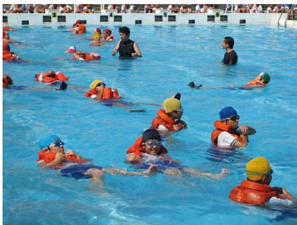
小学校プールでの安全講習(平成21年)