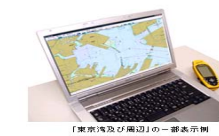
「東京湾及び周辺」の電子参考図