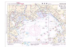
ヨット・モータボート用参考図(Yチャート) H-171W (東京・千葉)

プレジャーボートを運航する方のために、沖合から沿岸域にかけての目標・針路・障害物など、最新情報を盛り込んだB3版・多色刷の図です。