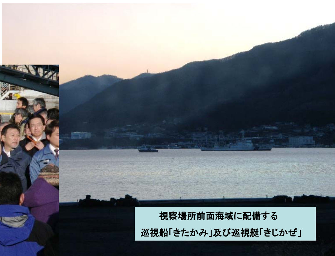
視察場所前面海域に配備する 巡視船「きたかみ」及び巡視艇「きじかぜ」