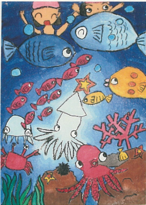
第二管区海上保安本部優秀賞 (小学生高学年の部)