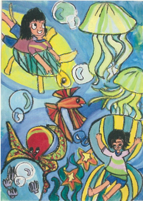
第二管区海上保安本部優秀賞 (小学生低学年の部)