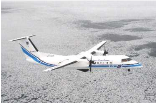
海氷観測中の当庁航空機