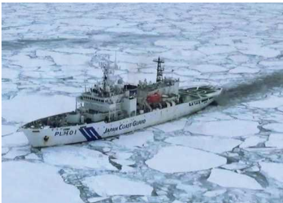
海氷観測中の巡視船そうや