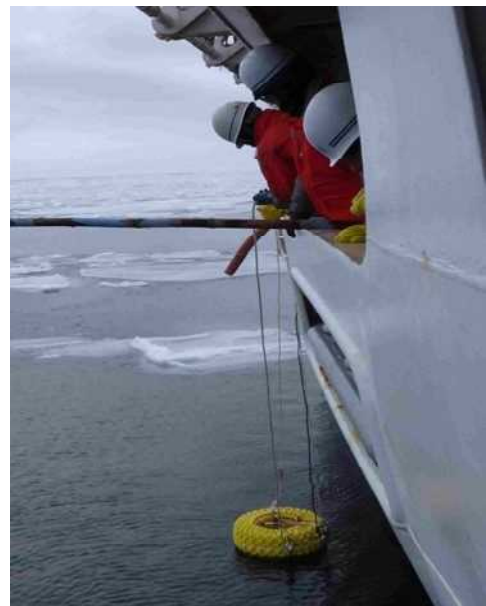
観測機器による調査